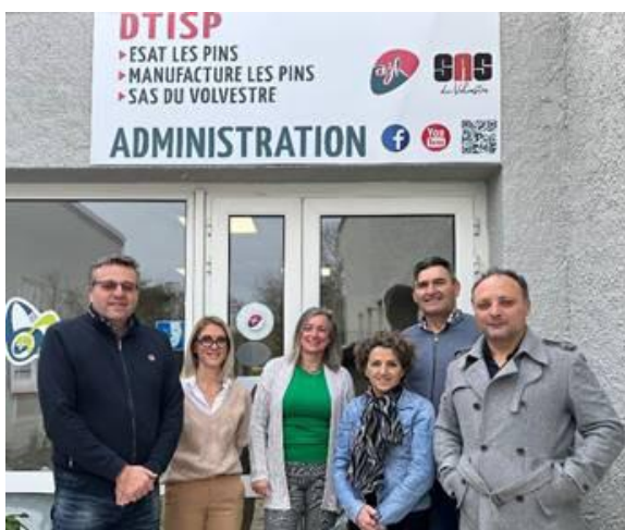
De gauche à droite